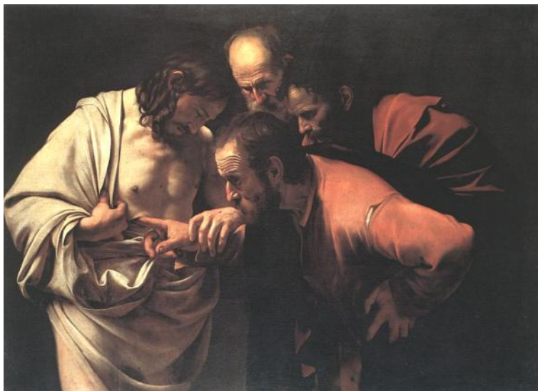
Le Caravage, L'incrédulité de saint Thomas , 1601-1602

l'humilité de se disposer à recevoir une vérité qui (sans s'opposer à notre raison) nous dépasse. Son propos est de nous donner d'accéder à la Révélation qui excède nos sens, dépasse nos raisonnements.